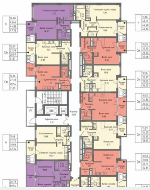
Секция 3 Этаж 2