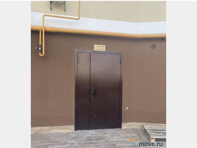
ЭКСПЛИКАЦИЯ внутренних площадей помещений г.Керчь, ул.Блюхера, 11 квартира 251